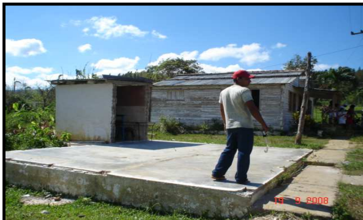
Estado actual de la ludoteca “Mil Cumbres” tras el paso del ciclón

Este proyecto pretende reconstruir la ludoteca de “Mil Cumbres” , se trataba de una edificación construida de madera y techos de zinc. Tras el paso del ciclón, ésta no existe. Debido a los destrozos se han tenido que suspender las actividades educativas culturales que allí se realizaban, viéndose afectados niñas, niños, jóvenes y vecinos de la comunidad.